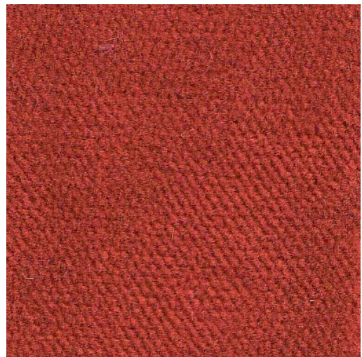
T393-348 - feu