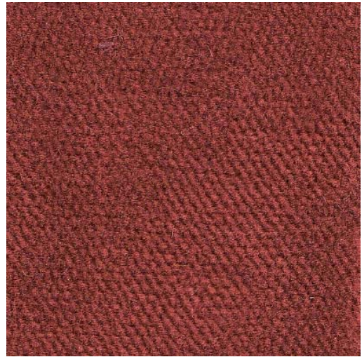
T393-20 - brique