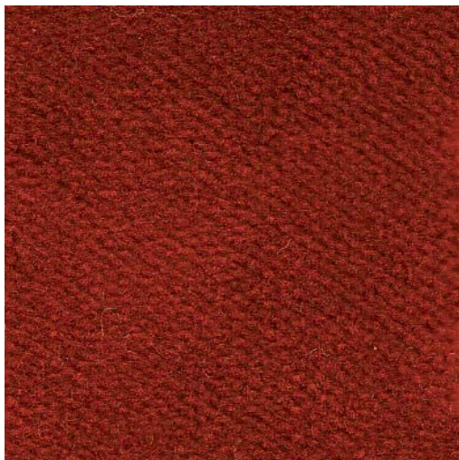
T393-25 - rouge