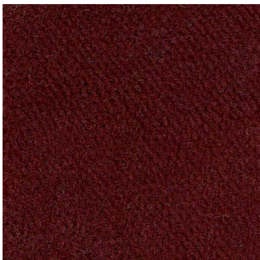
T393-3106 - cardinal